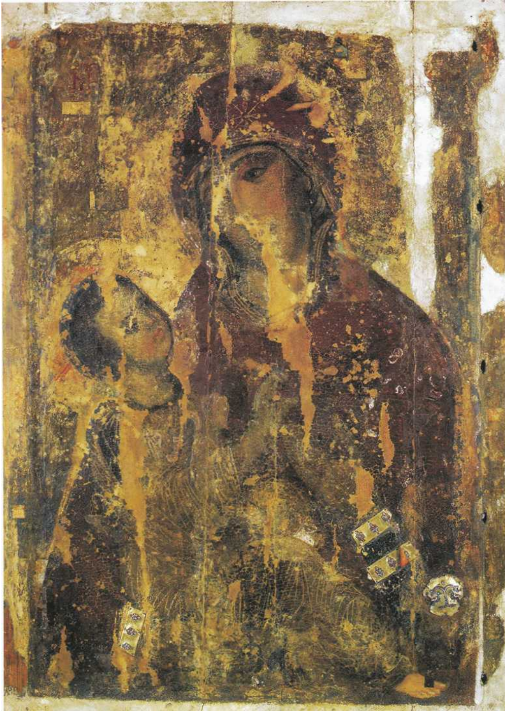
Ікона "Богородиця-Дороговказиця" (Холмська Богородиця), XI ст. Музей Волинської ікони, Луцьк.