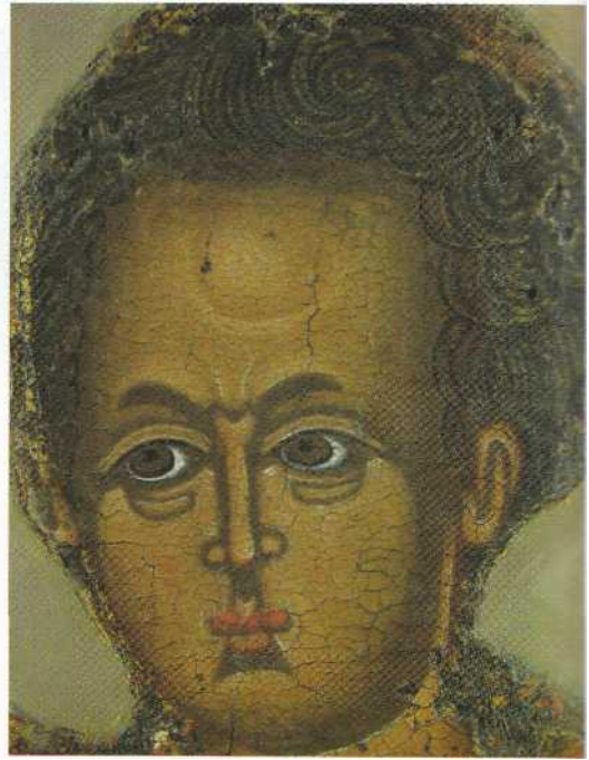
Фрагменти ікони "Богородиця-Дороговказиця" з церкви Успіння Пресвятої Богородиці з села Дорогобуж. Друга половина XIII ст. Рівненський обласний краєзнавчий музей.