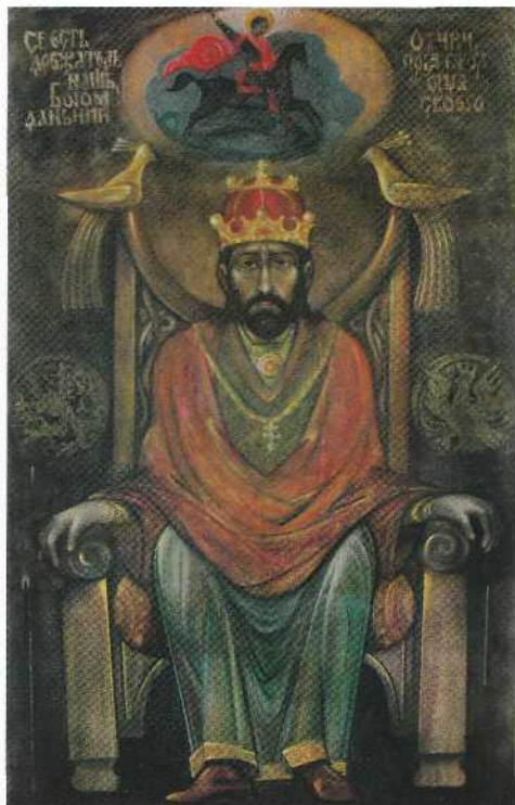
Мирослав Откович. Частини композиції-поліптиха "Король Данило - засновник міста Львова", 2006. Полотно, акварель, темпера.