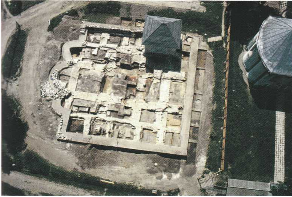
Загальний вигляд (зверху) археологічного розкриття решток Успенського собору. Територія давнього Галича (тепер село Кринос, Галицького р-ну Івано-Франківської обл.).