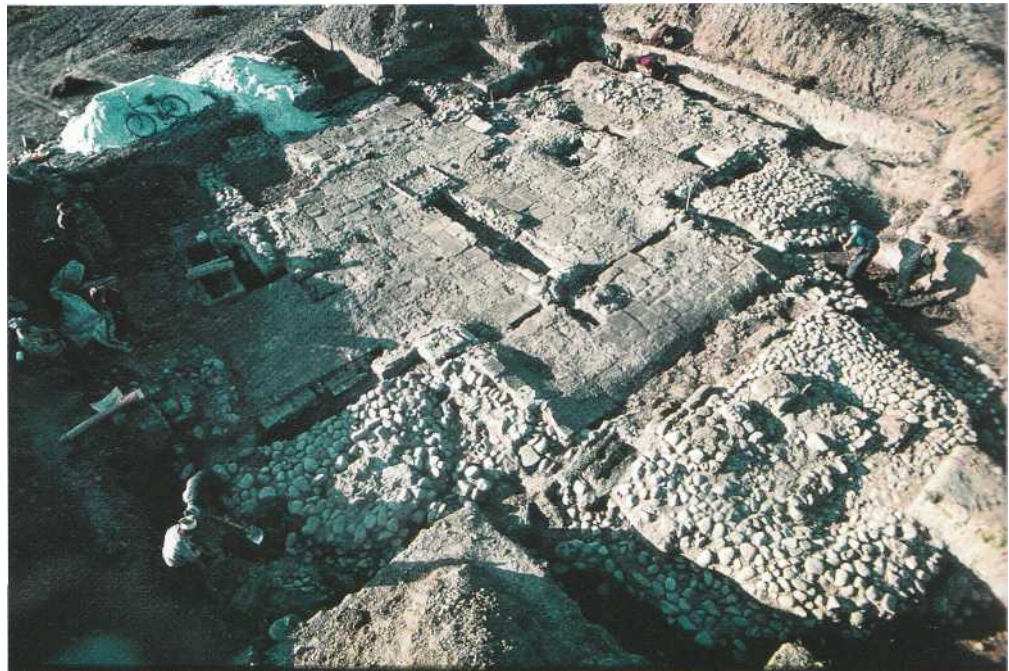
Загальний вигляд археологічного розкриття решток церкви на Царинці (канівської?) з південного сходу. Територія давнього Галича (тепер село Крилос).