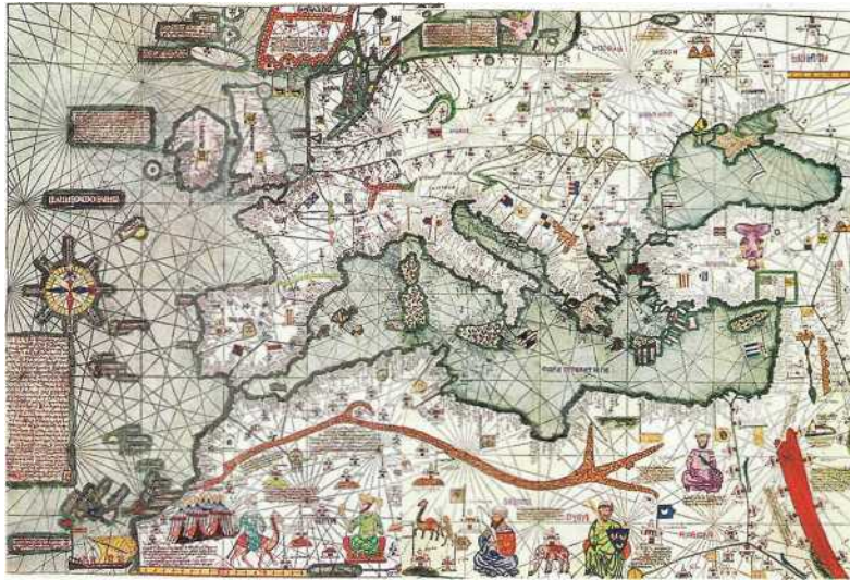
Фрагменти Каталонського атласу, 1375р.