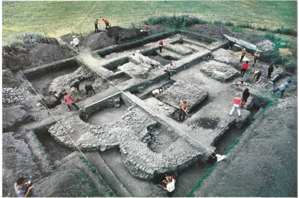
Загальний вигляд археологічного розкриття решток Кирилівської церкви з північного сходу. Територія давнього Галича (тепер село Крилос, Галицького р-ну Івано-Франківської обл.).