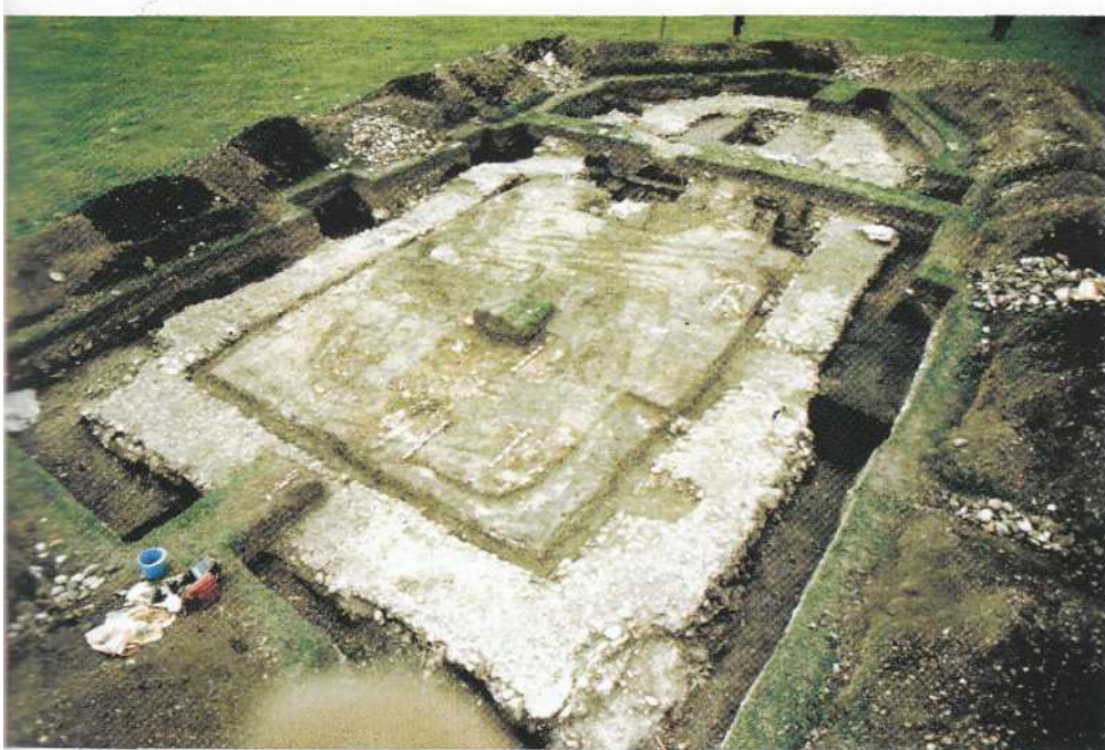
Загальний вигляд археологічного розкриття решток церкви Благовіщення на полі Церквиська. Територія давнього Галича (тепер село Кринос, Галицького р-ну Івано-Франківської обл.).