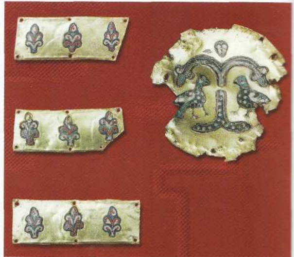
Прикраси з ікони "Богородиця-Дороговказиця " (Холмська Богородиця), XI-XII ст. Золото, срібло, позолота, перегородчасті кольорові емалі.