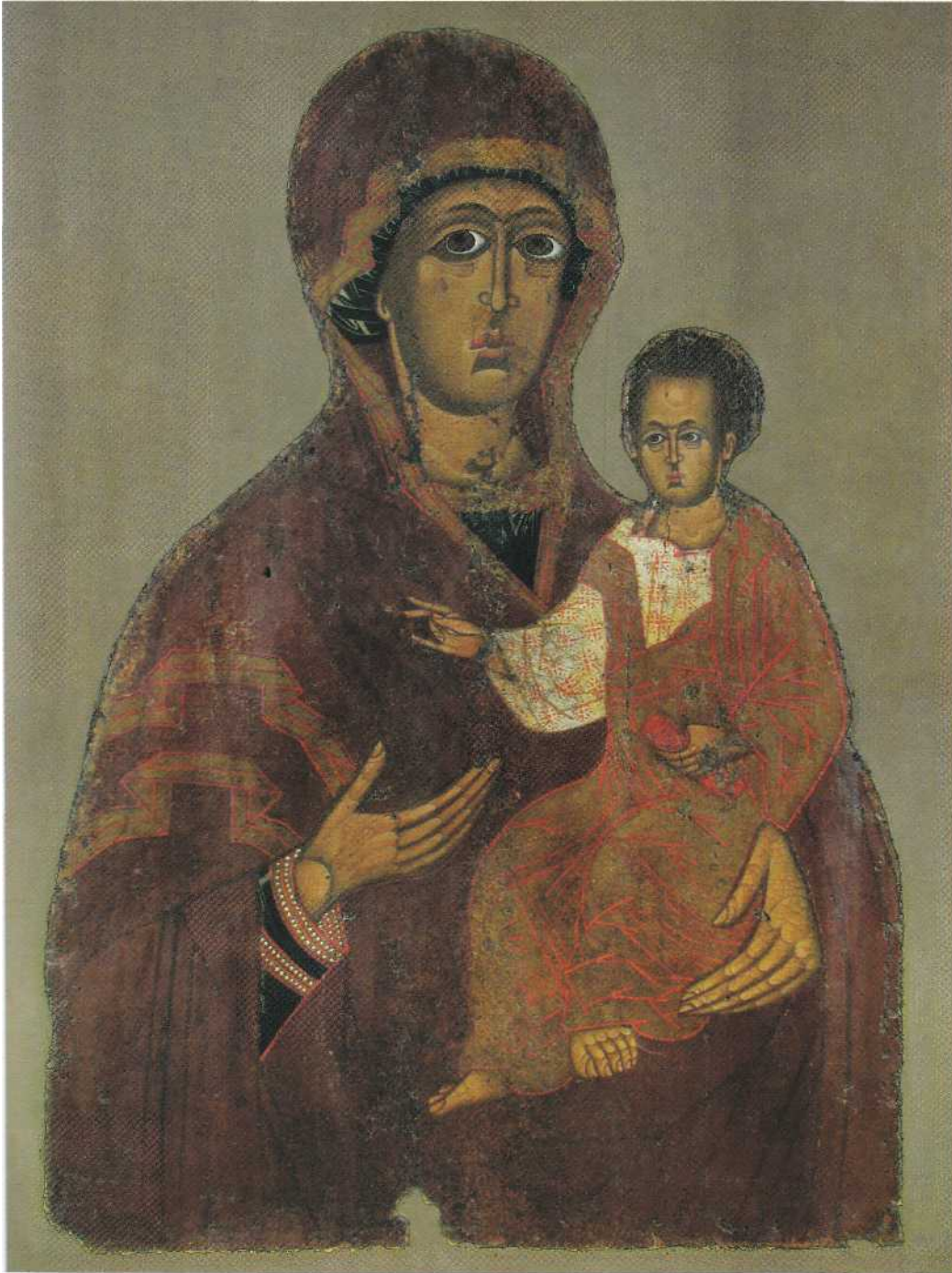
Ікона "Богородиця-Дороговказиця" з церкви Успіння Пресвятої Богородиці з села Дорогобуж. Друга половина XIII ст. Рівненський обласний краєзнавчий музей.