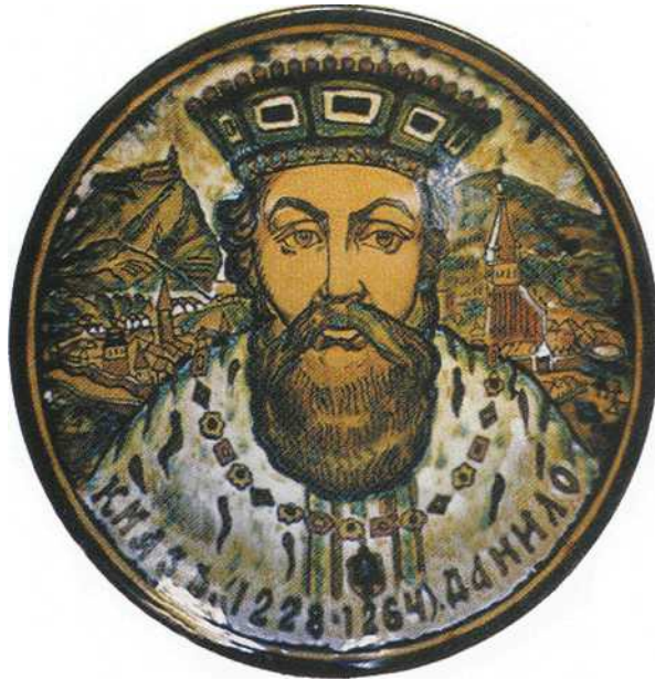
Григорій Кічула. "Князь Данило Галицький", 1981. Декоративна керамічна тарілка.