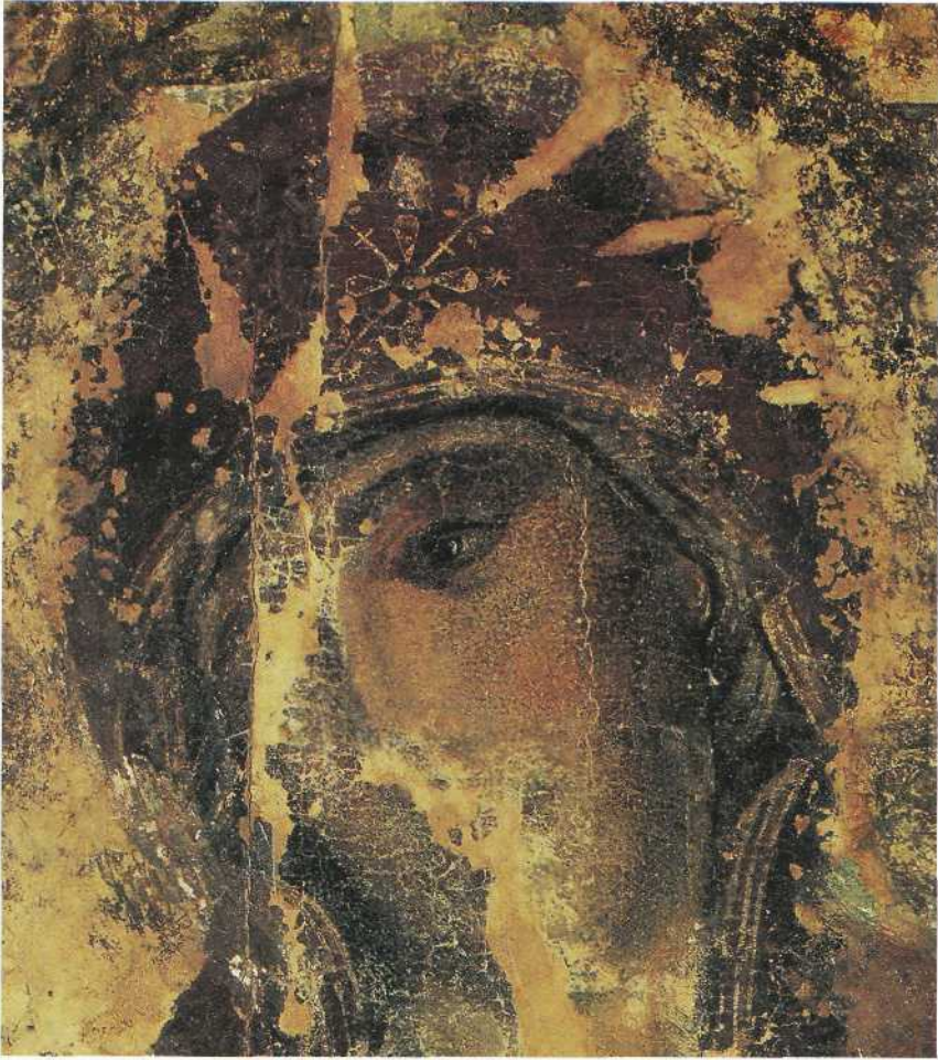
Фрагмент ікони "Богородиця-Дороговказиця " (Холмська Богородиця), XI ст. Музей Волинської ікони, Луцьк.