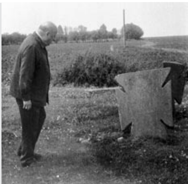
Павло Жолтовський під час однієї з експедицій, 1970-ті рр.