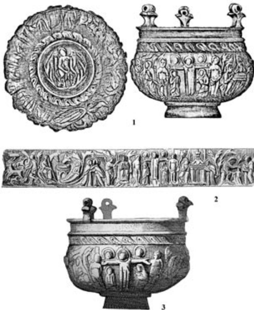
Рис. 1. Судацьке кадило

Разомзпроаналізованим кадилу тому ж 1869 р. був знайдений й ланцюжок від нього. Останній складався з трьох, поєднаних за допомогою “розподільника” ланцюжків, які, в свою чергу, мали чотири ланки, поєднані незамкнутими кільцями. Три з них