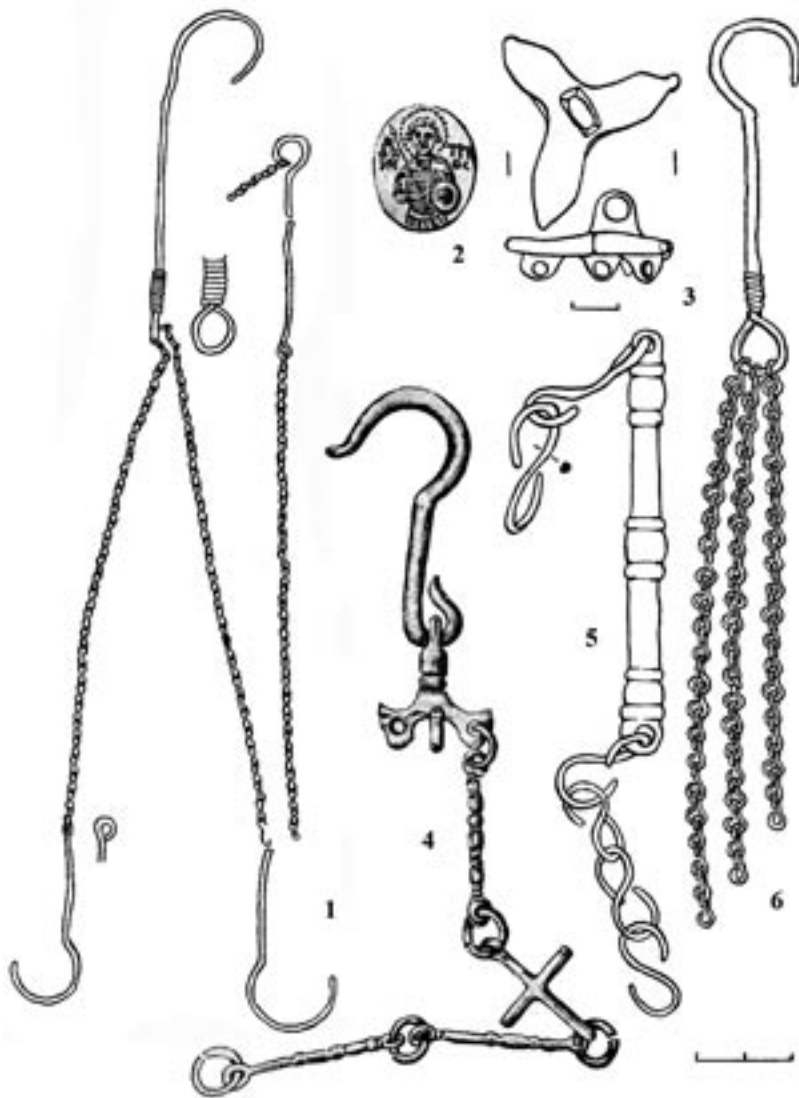
Рис. 2 – Ланцюжки від кадил та скляна ікона. 1,6 – городище на плато Тепенсь; 2 – Судац (за М. Мурзакевичем); 3,5 – Судац, куртина XV; 4 – ланцюжок від кадила (за М. Мурзакевичем).

саме, скляну наперсну ікону овальної форми із зображенням Димитрія Солунського (рис. 2, 2), одягнутого у військові лати зі списом у правій та щитом з хрестом у лівій руці [1, с. 321]. Як вказано, ікону було знайдено у 1863 р. на Судацьких виноградниках. Датовати подібні ікони важко, проте не виключено, що вона відноситься до періоду в історії Сугдеї, що розглядається.