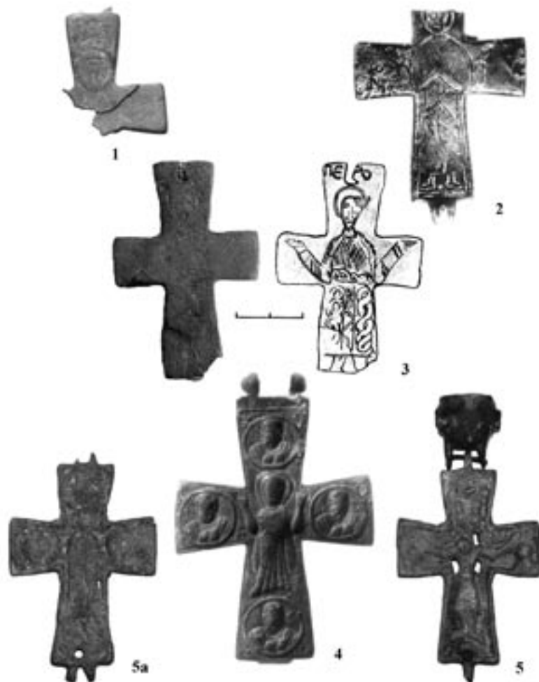
Рис. 3. Східні енколпіони середньовічної Сугдеї.

Унікальним для Криму та Сугдеї є фрагмент верхнього та лівого променя стулки енколпіону, що походить з розвідок на території Судацької фортеці у