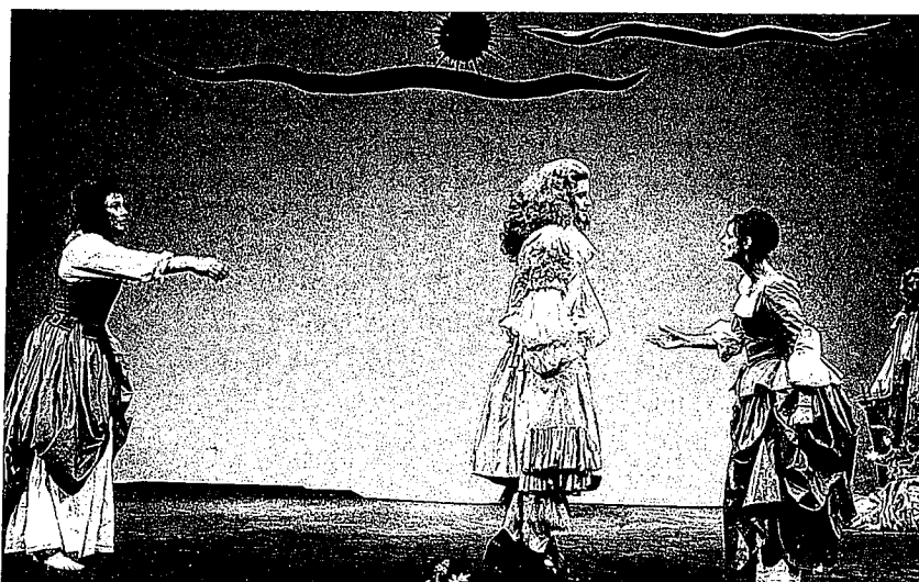
Сцена з вистави "Дон Жуан" Ж.-Б. Мольєра, 1979, Комеді-Франсез.